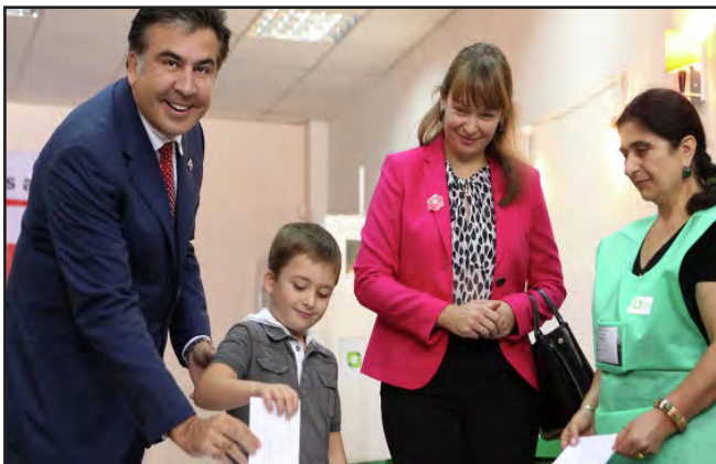
Präsident Saakaschwili mit seiner Familie

Nun ist die Überraschung perfekt: In einer unerwarteten Wende der Ereignisse hat das Koalitionsbündnis „Georgischer Traum“ unter der Führung von Bidsina Iwanischwili die Parlamentswahlen für sich entschieden und das neunjährige Machtmonopol der Vereinten Nationalen Bewegung gebrochen. Laut der vorläufigen Ergebnisse der Zentralen Wahlkommission liegt bei der Parlamentswahl in Georgien das Oppositionsbündnis Georgischer Traum nach Auszählung von über 95% der Wahlzettel mit knapp 55% Prozent der Stimmen klar in Führung. Besonders erfreulich aus liberaler Sicht ist, dass die beiden liberale Parteien im Oppositionsbündnis mit