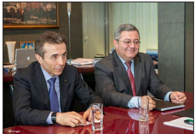
Oppositionsführer Bidsina Iwanischwili (li) und David Usupachwili, Vorsitzender der liberalen Republikanischen Partei

Dies änderte sich im Sommer 2011 mit dem Auftreten des Multimilliardärs Bidsina Iwanischwili, der es sich laut eigener Aussage zum Ziel gesetzt hatte, der „unsäglichen Arroganz“ und dem „zunehmenden Autoritarismus“ des amtierenden Präsidenten Einhalt zu gebieten. Mit dem ‚Georgischen Traum‘ schmiedete Bidsina Iwanischwili gemeinsam mit seinen beiden politischen Partnern, der Republikanischen Partei Georgiens und den Freien Demokraten, ein tatkräftiges Oppositionsbündnis, dem sich bald drei weitere Parteien anschlossen.