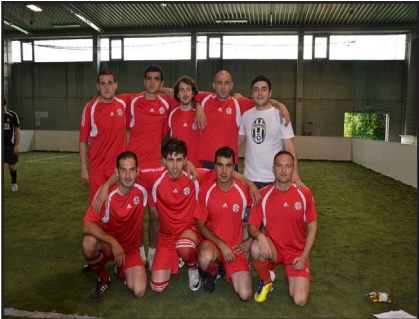
„გაერთიანებული საქართველო“ (შტუტგარტი)