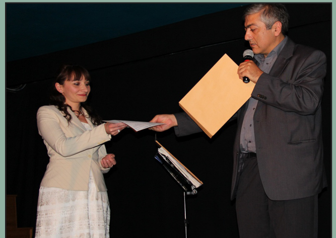
წლის საუკეთესო სტუდენტის დაჯილდოვება